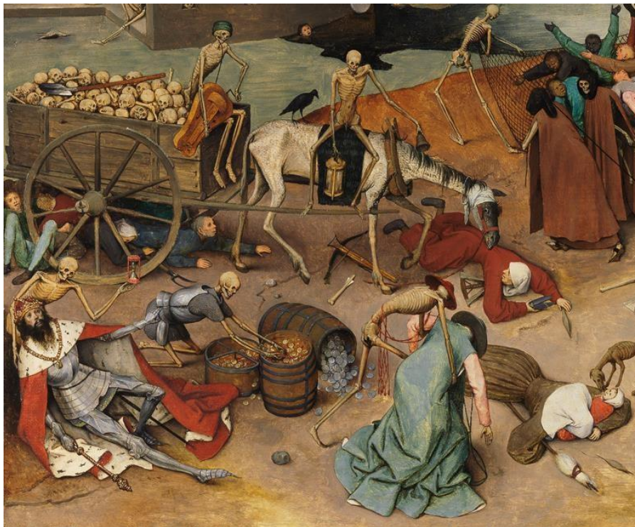
Figura 1. Detalle de 'El triunfo de la muerte' de Pieter Bruegel el Viejo, c. 1562 (Museo del Prado, Madrid). Se cree que esta pintura fue inspirada por brotes de peste.